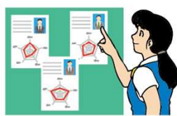
運転者の適性等の把握