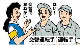
交替運転者の配置