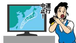
異常気象時等の措置