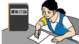
運転日誌の備付け