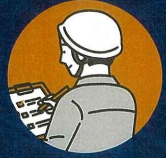
自社の安全対策が十分か 再確認したい