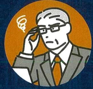
発注者だけど 足場のことがよくわからない