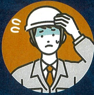
足場の上で 怖い思いをした