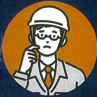
危ない場面が多く 何が原因か分からない